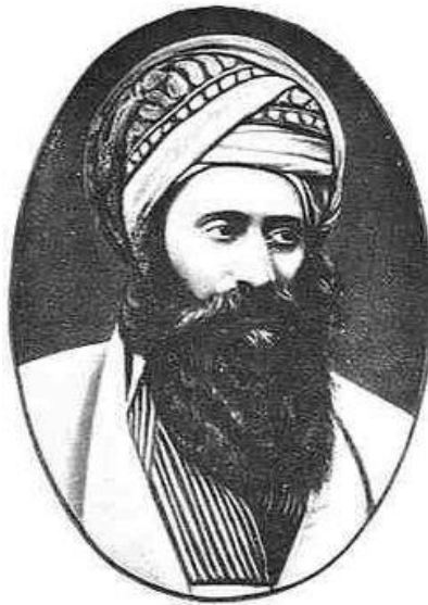
Yosef 'Hayim dit « le Ben Ish 'Haï »

En 1908, Kaduri reçut une bénédiction de Yosef 'Hayim (1 septembre 1832 - 30 août 1909, grand Rabbin mizra'hi, ayant autorité en matière de loi juive et Maître kabbaliste) selon laquelle avant sa mort, Kaduri verrait le Messie.